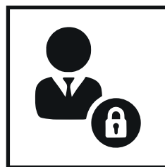
ASEGURADOS Y NO ASEGURADOS