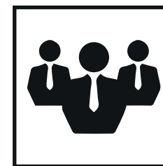
EJECUTIVOS DEL SECTOR ASEGURADOR

Los tres universos, individualmente, definen el ranking anual elaborado por CEOP Latam y Grupo Sol en base al exclusivo modelo de medición del prestigio empresarial