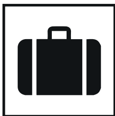
PRODUCTORES DE SEGUROS